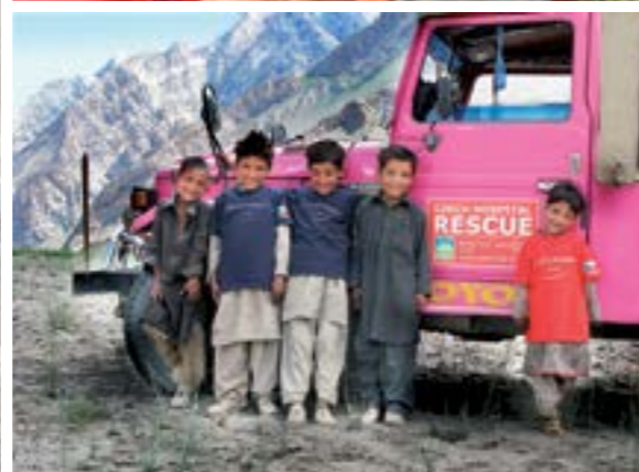
ŘÍKAJÍ JÍ MATKA ÚDOLÍ. „Pokud můžu zachránit patnáct dětí ročně, aby nezemřely bez antibiotik, nemůžu to neudělat.“

Vy jste se o nejvyšší horu planety pokoušela dvakrát, proč ty pokusy nebyly úspěšné?